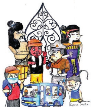
Gambar 3. Karakter Animasi Wayang

Adapun proses pembuatan animasi wayang anekdot dilakukan dengan beberapa tahap. Peneliti merancang alur cerita dan gambaran karakter tokoh serta menambahkan unsur pewayangan, seperti pemilihan warna, latar belakang cerita berdasarkan gambaran kehidupan sehari-hari, dan gambar kostum pendukung karakter tokoh.