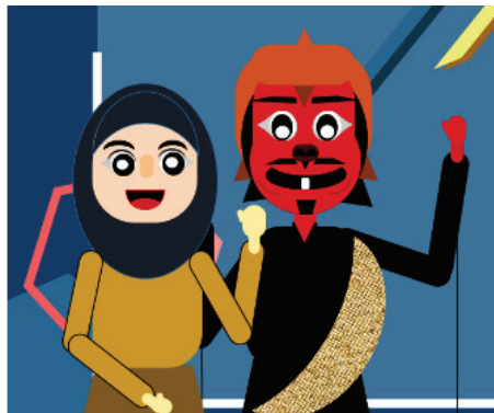
Gambar 1. Animasi Wayang

Peneliti mengumpulkan data saat materi teks anekdot dengan pembelajaran jarak jauh di kelas X.IPS.3 pada 3 November 2020 melalui Zoom . Adapun wawancara dengan guru Bahasa Indonesia dan siswa kelas X.IPS.3 pada 6 November 2020. Data dalam penelitian ini adalah hasil karangan teks anekdot siswa yang mengandung tema politik, ekonomi, sosial, dan budaya dengan jumlah 36 teks anekdot. Google Classroom juga dimanfaatkan untuk memberikan materi, pranala video animasi wayang, dan pengumpulan tugas menulis teks anekdot.