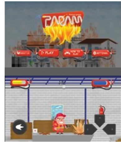
Gambar 4 User Interface Game

Pembuatan game juga memuat perancangan user interface agar game yang dibuat dapat sesuai dengan visibility dan usability pengguna. User interface yang dirancang memuat struktur menu, halaman menu utama, halaman mulai, halaman cara bermain, halaman tentang, dan halaman pengaturan.