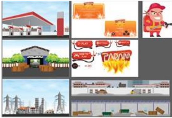
Gambar 3 Cutscene Game