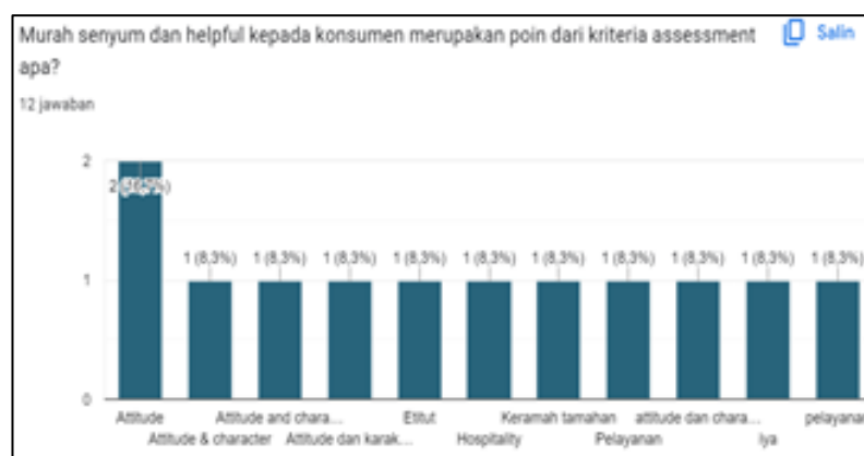
Gambar 5. Hasil Kuesioner Tambahan

Dari hasil kuesioner, diketahui bahwa telah muncul kesadaran dari semua staff atau peserta terkait dengan pentingnya melakukan pelatihan hospitality demi meningkatkan kompetensi dan pengembangan diri demi menjadi personal yang lebih profesional lagi. Kedua, muncul minat dan antusias dengan kegiatan semacam pelatihan dan pengembangan diri dengan respon yang baik dan keinginan kegiatan berkelanjutan dengan topik lain. Ketiga, Kondisi mitra setelah dilaksanakan PKM terjadi perubahan pengetahuan yang signifikan terkait dengan topik English for hospitality berikut juga dengan keterampilan berupa keberanian dan makin percaya diri dalam pengucapan bahasa Inggris yang benar karena sebelumnya para staff rata-rata melafalkan bunyi /f/ menjadi /p/ hal ini dikarenakan aspek bahasa daerah mereka (suku sunda). Terakhir adalah hasil dari isian google form tambahan yang dapat terlihat pada tabel berikut: