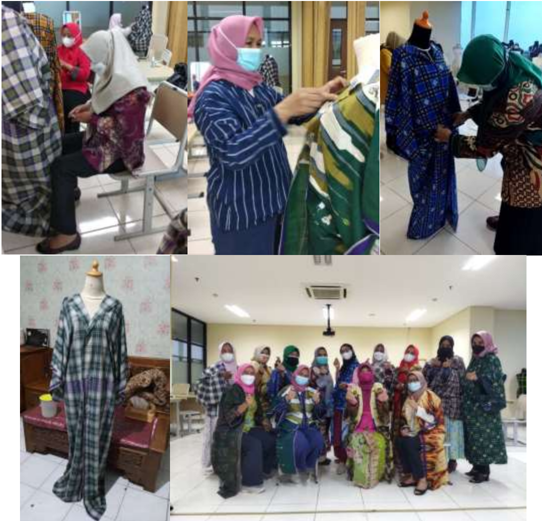
Gambar 3. Dokumentasi kegiatan dan hasil karya peserta