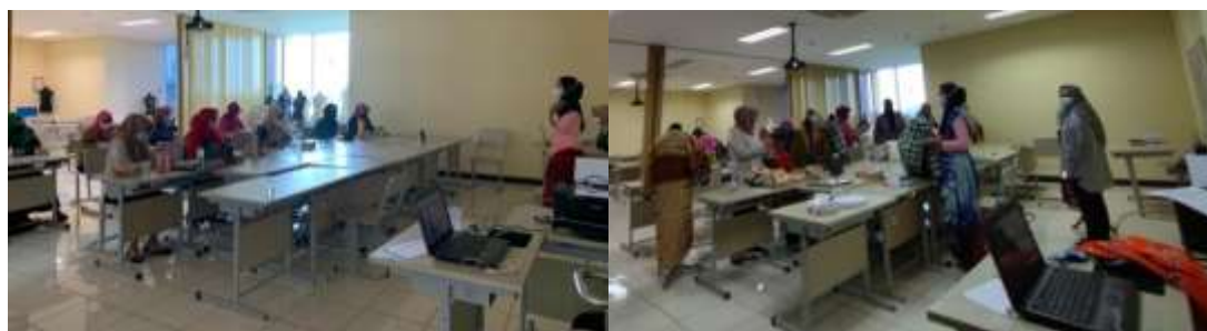
Gambar 2. Dokumentasi pemberian materi oleh instruktur