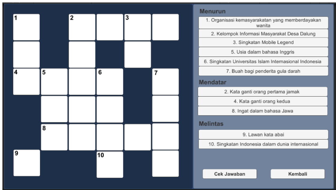
Gambar 2 Tampilan gameplay aplikasi digital memory game

Posyandu Lansia (Pos Pelayanan Terpadu Lansia) di Kelurahan Srengseng Sawah, Jakarta, merupakan bagian dari upaya pemerintah untuk meningkatkan kesehatan dan kesejahteraan lansia. Kegiatan ini dilaksanakan secara berkala satu bulan sekali dan melibatkan berbagai pihak, termasuk tenaga medis, relawan, dan masyarakat sekitar.