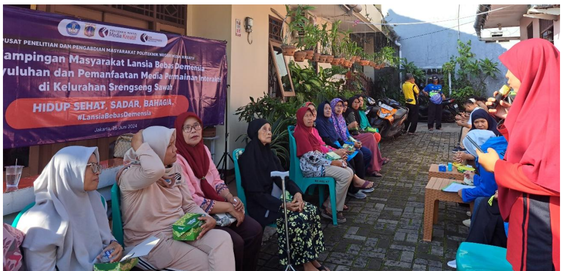
Gambar 4 Kegiatan pendampingan masyarakat posyandu lansia

Tahapan pelaksanaan pendampingan dilakukan pada tanggal 26 Juni 2024 di salah satu posyandu lansia di kelurahan srengseng sawah. Peserta kegiatan adalah masyarakat kelompok lansia yaitu pada rentang usia diatas 60 tahun. Pelaksanaan kegiatan diawali dengan senam sehat, penyuluhan dan pemanfaatan media interaktif sebagai terapi pencegahan lansia. Dokumentasi kegiatan pendampingan tertera pada gambar 4.